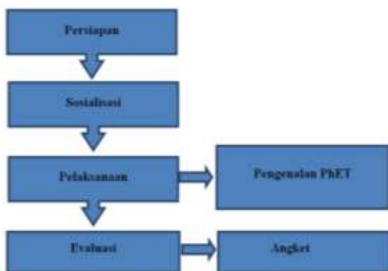
Gambar 1. Diagram Kegiatan Pengabdian

Metode yang digunakan dalam kegiatan ini adalah Metode Participatory Action Research (PAR) karena memerlukan partisipasi santri untuk menerapkan informasi santri atas solusi masalah pembelajaran yang dilaksanakan (Didik, 2019; Meiliyadi & Syuzita, 2022; Meri et al. , 2020). Peserta adalah siswa SILN Riyadh sebanyak 30 orang yang merupakan santri TPQ Al-Akidah. Secara umum kegiatan pengabdian pendampingan dari pihak lain dalam bentuk pengabdian kepada masyarakat misalnya kegiatan belajar mengajar yang diadakan oleh mahasiswa KKP UIN Mataram di TPQ Al-Akidah, Dusun Telage Ngembeng, Desa Nyurlembang, Kecamatan Narmada dilaksanakan dalam 4 tahap yaitu (a) persiapan, (b) sosialisasi, (c) pelaksanaan dan (d) evaluasi serta refleksi (Rahmaniah et al. , 2020; Safarati et al. , 2022). Skema kegiatan pelatihan ini disajikan pada Gambar 1.