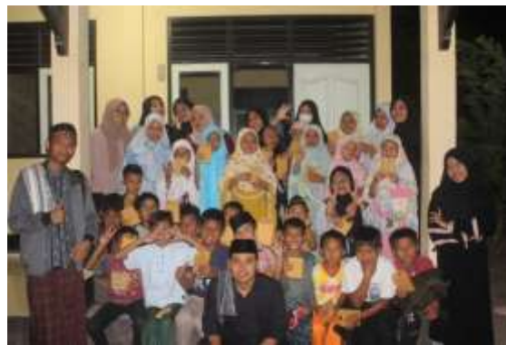
Gambar 3. Foto bersamasantri dan Pembina TPQ Al-Akidah

Kegiatan belajar mengajar diakhiri dengan do'a dan mengikuti shalat berjamaah di masjid Al-Aqidah. Setelah itu kegiatan terakhir adalah foto bersama dengan para santriseperti yang ditunjukkan pada Gambar 3.