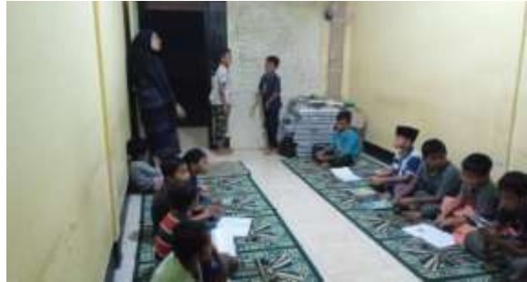
Gambar 2. Kegiatan pendampingan Bahasa arab

berbicara di depan. Kami pun menerapkan metode muhawarah ini, untuk melatih keberanian mereka melakukan percakapan dengan lawan bicara. Adapun kegiatan pendampingan ditunjukkan pada Gambar 2.