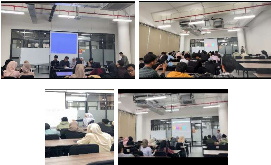
Gambar 2. Kegiatan pendampingan qira'ah

perangkat lunak. Selanjutnya, tim melaksanakan pendampingan akademik dengan model pembelajaran yang telah dipilih, dengan cara tatap muka selama 3 bulan terhitung dari bulan Oktober sampai Desember 2025. Setelah kegiatan pendampingan akademik selesai, tim melakukan evaluasi dalam bentuk post-test dan melakukan analisis hasil dan menyusun laporan pendampingan akademik.