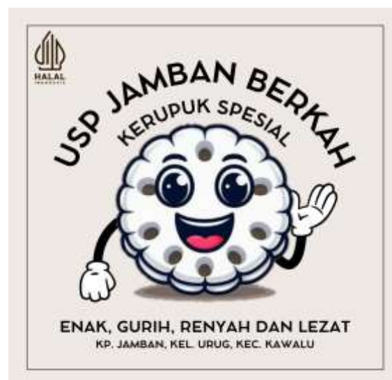
Gambar 5. Logo UMKM Kerupuk Spesial USP Jamban Berkah

tersebut, langkah-langkah yang diambil oleh Kelompok 1 Atma Wangsa untuk mendukung digitalisasi UMKM dilakukan melalui pembuatan logo bagi UMKM Kerupuk Spesial USP Jamban Berkah, pembuatan kemasan produk untuk UMKM Rengginang Sopiah Gurih, serta pembuatan video promosi bagi UMKM Mie Bakso Urat Renjul Aisah.