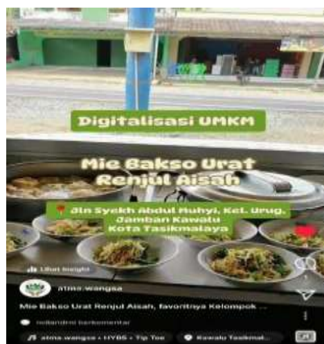
Gambar 7. Video Promosi Digitalisasi Usaha UMKM Mie Bakso Urat Renjul Aisah