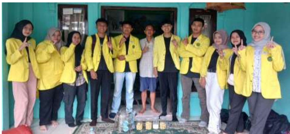
Gambar 1. Observasi Para Pelaku UMKM

Berdasarkan hasil observasi yang dilakukan oleh Kelompok 1 Atma Wangsa di RW 10, Kelurahan Urug, diketahui bahwa terdapat tiga pelaku UMKM yang belum memiliki izin usaha, sementara pelaku usaha lainnya telah mengantongi legalitas tersebut. Adapun UMKM yang belum memiliki izin mencakup: (1) Kerupuk Spesial USP Jamban Berkah, yang diproduksi oleh USP Koperasi Jamban; (2) Rengginang Ibu Sopiah Gurih, yang diproduksi oleh Ibu Sopiah; dan (3) Mie Bakso Urat Renjul Aisah, yang dimiliki oleh Ibu Aisah.