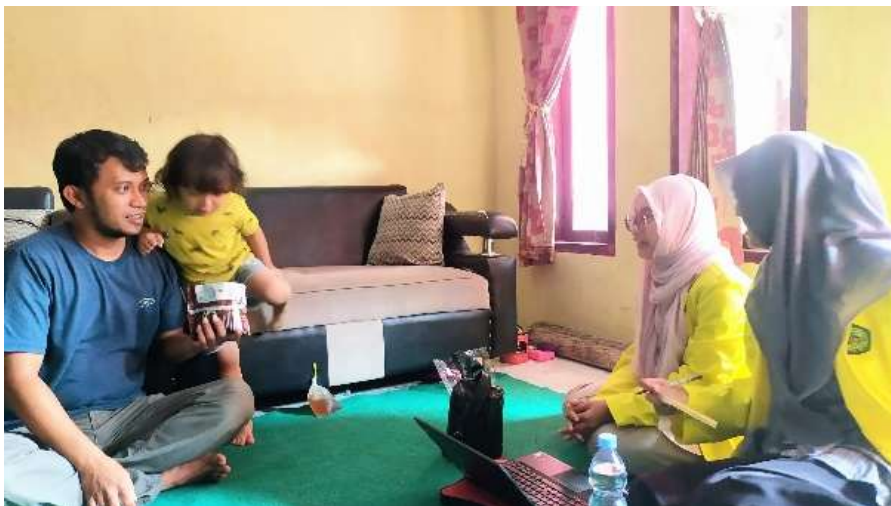
Gambar 2. Proses Pengisian Formulir NIB

dalam menjangkau UMKM dan mengidentifikasi kebutuhan riil bagi pelaku UMKM di Desa Mlawang. Penggunaan metode ini juga diharapkan para pelaku UMKM akan lebih memahami mengenai pentingnya legalitas usaha melalui pembuatan NIB. Pada kegiatan ini memberikan pendampingan mengenai apa itu NIB, apa pentingnya dan kegunaannya bagi kelangsungan usaha yang dimiliki. Selain itu, sesi tanya jawab juga disediakan untuk menjawab pertanyaan yang diajukan oleh para pelaku UMKM terkait pemaparan tersebut. Selanjutnya, memberikan bantuan dalam pengisian formulir yang memuat data diri pelaku usaha dan data usaha sebagai persyaratan pembuatan NIB. Pendampingan ini bertujuan untuk meminimalisir kesalahan dan kekeliruan data dalam pengisian formulir. Melisa et al. (2025) dalam pengabdiannya menjelaskan bahwa asistensi langsung pengisian data NIB sangat membantu pelaku usaha dalam menghindari kesalahan administrasi, sehingga strategi tersebut juga diterapkan pada pendampingan UMKM di RW 10 ini.