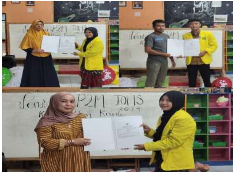
Gambar 4. Penyerahan NIB kepada Para UMKM

UMKM di mata konsumen maupun pemangku kepentingan.