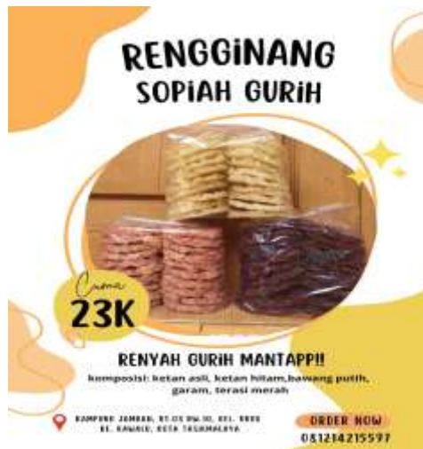
Gambar 6. Kemasan Produk UMKM Rengginang SopiAH GuriH