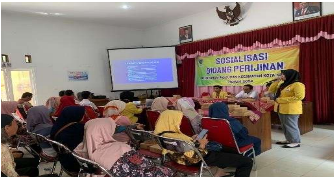
Gambar 1. Sosialisasi Pendaftaran NIB kepada Pelaku UMKM di Kelurahan Panjunan Setelah melengkapi semua data yang diperlukan, pelaku usaha harus menyetujui sejumlah pernyataan, antara lain pernyataan independen, K3L, sertifikasi

Proses pembuatan akun melibatkan pemilihan skala bisnis, mengonfirmasi informasi, memilih kata sandi, dan melengkapi profil pelaku bisnis. Lanjutkan ke portal web OSS dan masuk dengan akun yang dibuat sebelumnya. Lengkapi data pelaku usaha setelah itu (NPWP, BPJS Tenaga Kerja, BPJS Kesehatan jika sudah memilikinya). Jika Pelaku usaha sudah siap, akan muncul menu berikut, di mana mereka dapat mengisi detail tentang jenis kegiatan usaha, industri, dan jangkauan kegiatan.