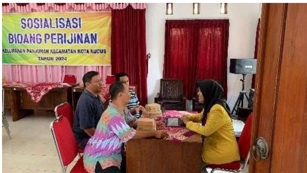
Gambar 2. Pendampingan Pendaftaran NIB

Setelah acara sosialisasi dan pendampingan Nomor Induk Usaha (NIB), peserta diberikan kuesioner, yang kami gunakan untuk mengumpulkan data. Jawaban atas kuesioner ini menawarkan informasi berharga tentang tingkat kepuasan orang dan tantangan utama yang mereka hadapi saat menjalani proses tersebut. Ada 68% orang yang mengikuti program sosialisasi dan pendampingan NIB menyatakan kepuasan umum dengan layanan yang ditawarkan. Mereka berpikir pelatihan itu bermanfaat secara keseluruhan dan informasi yang ditawarkan jelas, selain pendampingan yang sangat membantu. Di sisi lain, penyebab utama ketidakpuasan warga masing-masing sebesar 25% dan 7% adalah kesulitan teknologi yang dihadapi selama prosedur pendaftaran.