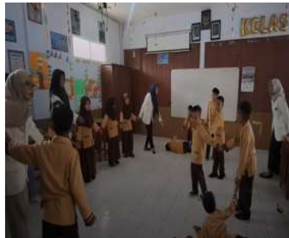
Gambar 2. Dokumentasi Pelaksanaan Proyek Aksi Nyata